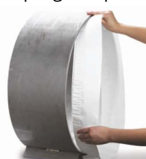
2-Colocar en tubería