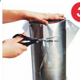
3-Cortar Film diám+30%