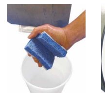
5-Pegar con esponja húmeda